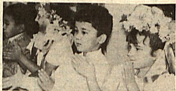
На снимке: детский праздник.