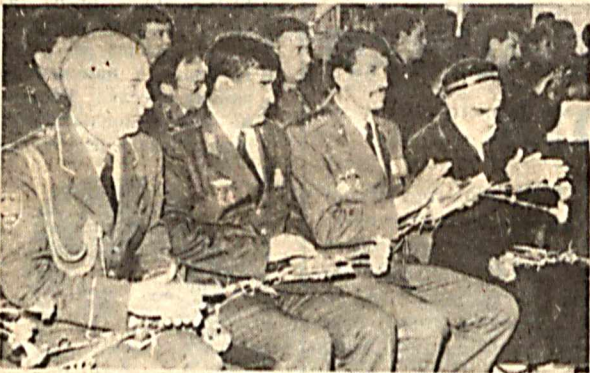
На снимках: вручаются награды.