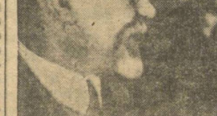
jaqında avis tirijonıñ xıquqlı qonsulnıñ s s s r mærkæzii çırqomıñnıñ ræ'isil ortaq petrovskı hızyrızga qanul qıldı srynda: ortaq petrovskı ham qonsul xıquqlı.