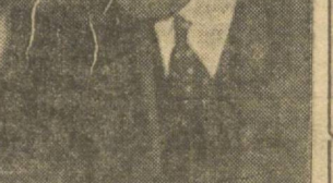
jaqında avis tirijonıñ xıquqlı qonsulnıñ s s s r mærkæzii çırqomıñnıñ ræ'isil ortaq petrovskı hızyrızga qanul qıldı srynda: ortaq petrovskı ham qonsul xıquqlı.