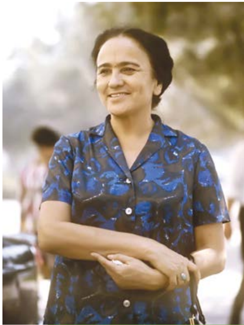
ЗУЛФИЯ Ўзбекистон халқ шоири