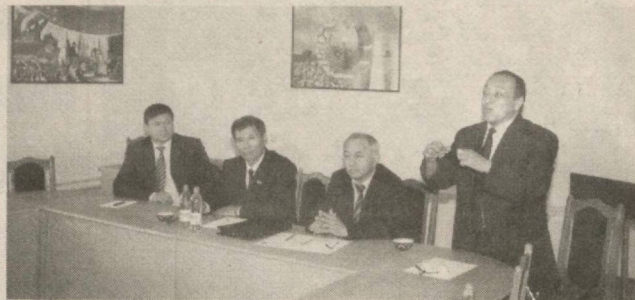
Кўпчилик эса илмий ишлари устида тер тўкишадир. Институтда илмий-тадқиқот иш-

– Мамлакатимиз истиқлолни қўлга киритгач, институтимиз фаолиятида ҳам янги-ча давр бошланди, десам асло янглишмаган бўлсам, – дейди Жиззах Давлат педагогика институти ректори, физика-математика фанлари доктори, профессор Олимжон Дўстматов. – Соҳага доир дастур ва қонунлар талабларидан келиб чиққан ҳолда институтимизда ўқув ва ўқитиш ишларини жаҳон андозалари талабларига яқинлаштиришга ҳаракат қилинмоқда. Барча хоналар, ўқув марказлари, бўлимлар замонавий компьютерлар билан жиҳозланган. Профессор-ўқитувчиларимиз, талабаларимиз интернет тармоғидан бемалол фойдаланаишадил. Институтнинг моддий-техника базасини замонавий ўқув қуролла-