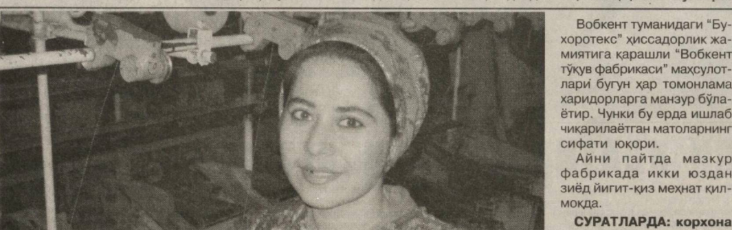
Вобкент туманидаги "Бухоротеқ" ҳиссдорлик жамиятига қарашли "Вобкент тўқув фабрикаси" маҳсулотлари бугун ҳар томонлама харидорларга манзур бўлаётди. Чунки бу ерда ишлаб чиқарилаётган матоларнинг сифати юқори.

сида бу Фармонлар асосида тушунтиришлар ва тарғибот-ташвиқот ишлари кучайтирилса. Бизлар ўзимизни ўйланган рақобат саволларга жавоб топаётган... -Мен Президентимизнинг ушбу Фармонлари ва қарорини илк бор радиодан эшитдим. Бунга бағишланган бир қанча телекурстувларни, бегона мулоқотларни кўрдим. Матбуотда уларнинг тўлиқ матни билан танишдим. Ҳар ҳолда бу борада тасаввурим ҳам, тушунчам ҳам етарли деб ҳисоблайман, - дейди