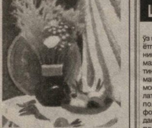
Беход КОДИРОВ СУРАТЛАРДА: расмчи иккунлик намуналар.

Замонавий компьютерлар кўп соҳага, шу жумладан, санъатга ҳам кириб келмоқда. Бу борада расм аъёнлар ушбу билан бирга компьютер графикасида ҳам иккунлик қилади.