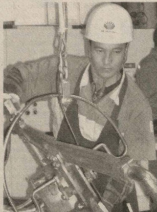
миллион долларлик маҳсулот чет эллик истеъмолчиларга жўнатилади.