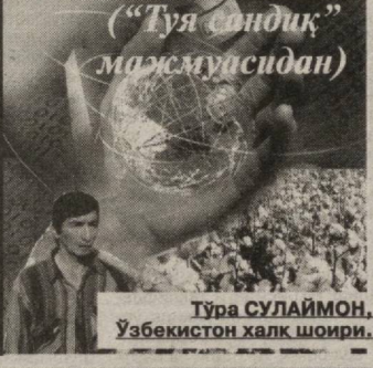
Тўра СУЛАЙМОН, Ўзбекистон халқ шоири.

(Давоми. Боши «Қишлоқ ҳаёти» газетаси иловаси «Ҳаётнинг 3,4,5,6 ва «Қишлоқ ҳаёти»нинг 93, 95, 96-сонларида.)