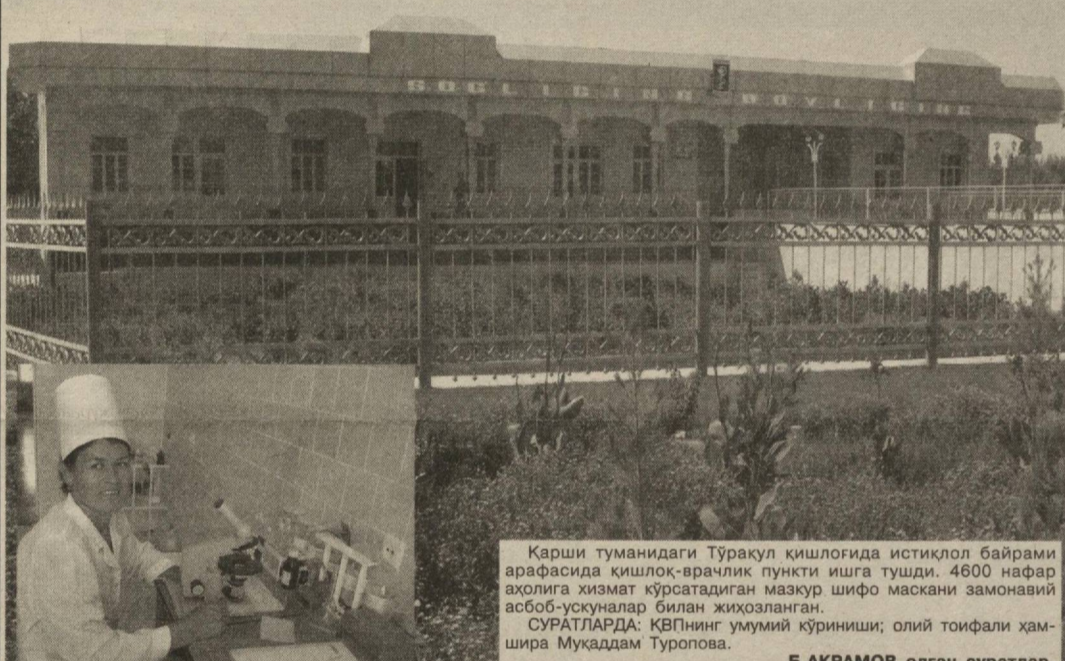
Қарши туманидаги Тўрақул қишлоғида истиқлол байрами арафасида қишлоқ-врачлик пункти ишға тушди. 4600 нафар аҳолиға хизмат қўрсатадиган мазкур шифо маскани замонавий асбоб-ускуналар билан жиҳозланган. СУРАТЛАРДА: ҚВПнинг умумий қўриниши; олий тоифали ҳамшира Муқаддам Туропова. Б.АКРАМОВ олган суратлар.

Мустақилликка эришибмизки, биз миллий гурур, миллий маънавият, миллий қадрият, ўзликини англаш ҳақида кўп гапирганимиз ва кўп ёзмамиз. Бу табиий ҳол, албатта. Чунки биз шунга ташна бўлиб яшайдиқ. Истиқлол туфайли миллий гуруримиз ошди, маънавиятимиз юксалди, қадриятларимиз қадр топти, ўзлигимизни - ўзимизнинг ким эканлигимизни яхшироқ англаб етдик. Бирок гурур ва фахр-ифтихор тўғрисида дилимизда қай даражада муҳрланган қолмоқда? Бу саволға жаваб излаб қўрайлик.