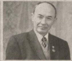
"Эшилиб, тўлганиб ингранди куй..."