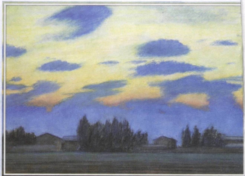
Акрам Бахрамов. Вечер-1