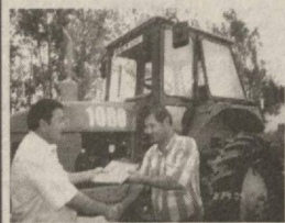
Лизингга 1000 - трактор