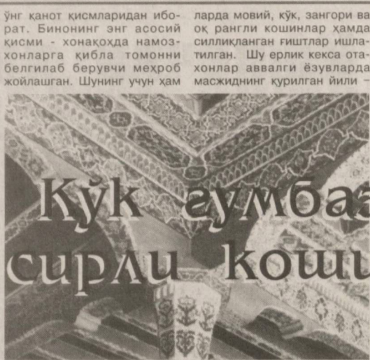
Кўкғумбазнинг сирли кошчинлари

Бугунги кунда буюқ аждодларимиз ақл-заковати, тафаккурининг тибсоли бўлган тарихий обидалари асраб-авайлашга катта эътибор қаратиляпти. Ҳаётининг тарихий воқеаларга гувоҳ бўлган осори-атиқалар қаршида бир зум уйга чўшиб, рўҳингиз тетиклашади, дилингизни гурур хисси чулғайди. Қарши шаҳрида ҳам XV-XVI асрларда гўзал мезморий ечимга эга бўлган кўп қабатли тарихий обидалар барпо қилинган. XVI аср охирида шайбонийлардан Абдуллахон II (1534-1598) ҳукмронлиги даврида бу шаҳарда Кўкғумбаз жоме масжиди бунёд этилди. Тарихчи олимларнинг таъкидлашича, Кўкғумбаз ҳайит намозлари учун уйланган бўлиб, унда одамлар йилга икки марта – Рамазон ва Қурбон ҳайитлари маросимларида тўпланишган. Масжид биноси усти гўмбаз шаклида бўлиб, асосий бош хона – хонақоҳ ҳамда унинг икки ёнидаги чап ва