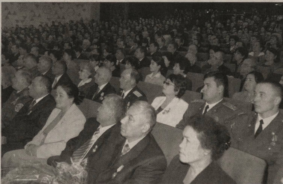
Халқимиз ва мамлакатимиз ҳаётида рўй бераётган буюк ўзга-ришларнинг туб моҳияти Консти-туциямизда белгилаб, муҳрлаб қўйилган ҳуқуқ ва имкониятлар, асосий тамойилларни ҳаётга тўлиқ татбиқ этиш билан боғлиқдир. Ўзбекистон танлаган йўл - демокра- умумэътироф этилган ва асосий принципларига таянадиган, айни чоғда мамлакатимизнинг тарихий, миллий хусусиятларига, халқимиз-нинг дунёқарашига асосланган ўзи-мизга хос ва ўзимизга мос йўлимиз-га - тараққиётнинг «Ўзбек модели»-га доим содиқимиз.