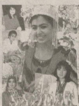
лиятини ҳақида фикр-мулоҳазалар баён қилинади.