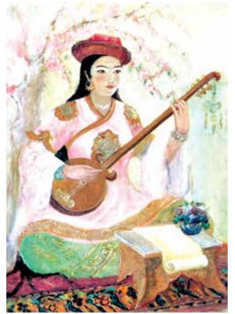
Шоира Мутриба. (1947)