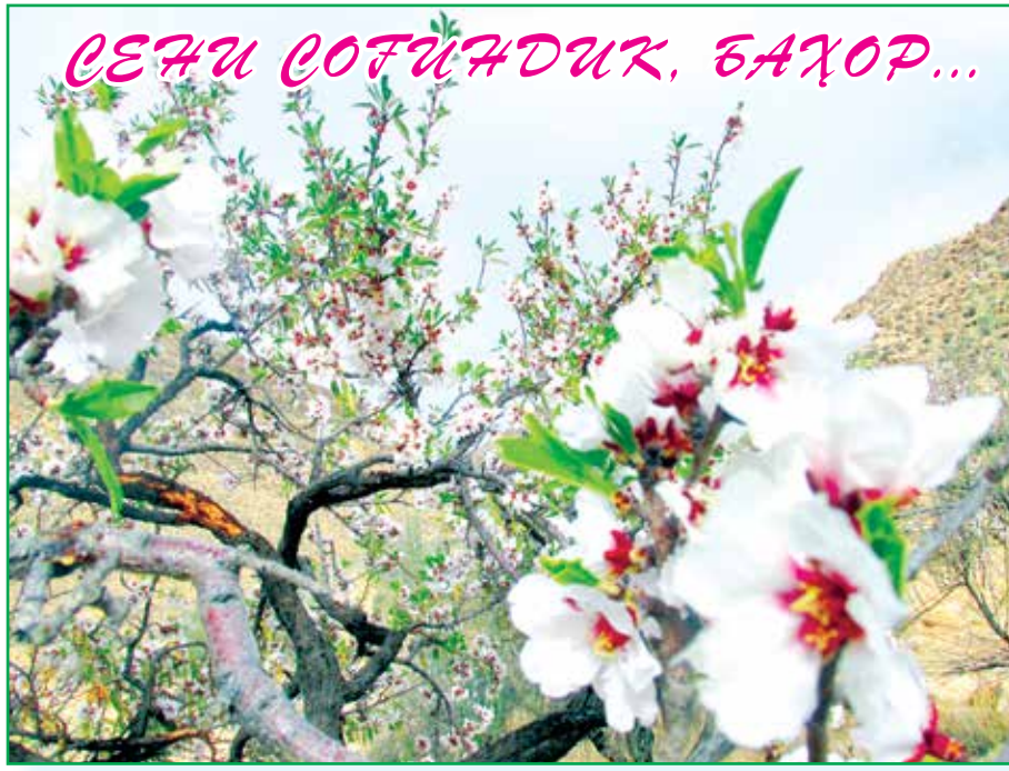
СЕНДИ СОҒИНДИК, БАҲОР...