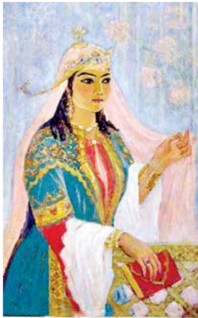
Шоира Нодира. (1944-1945)