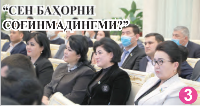
“СЕН БАҲОРНИ СОҒИНМАДИНГМИ?”