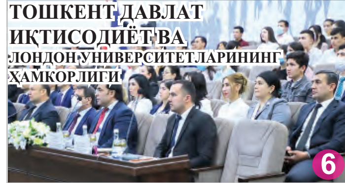
ТОШКЕНТ ДАВЛАТ ИҚТИСОДИЁТ ВА ЛОНДОН УНИВЕРСИТЕТЛАРИНИНГ ХАМКОРЛИГИ