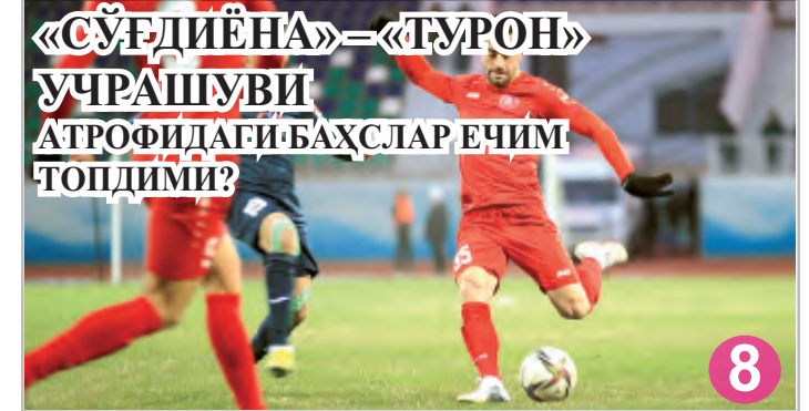
«СЎҒДИЁНА» = «ТУРОН» УЧРАШУВИ АТРОФИДАГИ БАҲСЛАР ЕЧИМ ТОДИМИ?