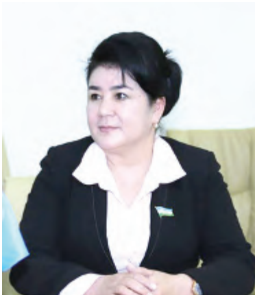
Мавжуда ҲАСАНОВА, Ўзбекистон Республикаси Олий Мажлиси Қонунчилик палатаси депутати:

— Чиндан ҳам, ота-она ўз боласини кимга кўпроқ ишонади? Тўғри, боланинг соғлиги, иссиқ-совуғи, еб-ичиши учун ондан ортққ қайғурадиган одам йўқ. Ота эса “Мен борманми, болам ҳеч қачон қаровсиз-эътиборсиз қолмайди” дейди.