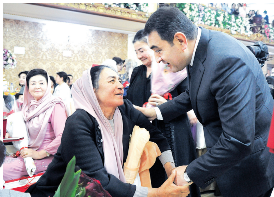
Фарғонада Халқаро хотин-қизлар кунига бағишланган байрам тантанаси бўлиб ўтди.