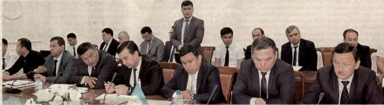
ЗАСЕДАНИЕ ФРАКЦИИ НДП УЗБЕКИСТАНА