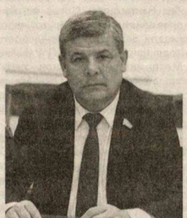
Абдугапвор КИРГИЗБАЕВ, председатель Комитета Законодательной палаты Олий Мажлиса по вопросам науки, образования, культуры и спорта, член фракции НДП Узбекистана.

Немаловажно и то, что за последние годы уделяется особое внимание последовательному стимулированию работников науки и образования. Так, с 1 сентября прошлого года ежемесячная заработная плата научных сотрудников возросла на 25 процентов, а с 1 января текущего года – еще на 20 процентов. В продолжение этой работы Президент предложил установить с 1 сентября надбавки к заработной плате кандидатам наук, занимающимся научно-педагогической деятельностью в государственных организациях, в размере 30