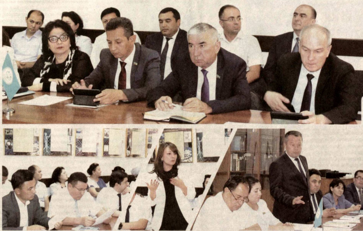
ЗАСЕДАНИЕ ФРАКЦИИ НДП УЗБЕКИСТАНА