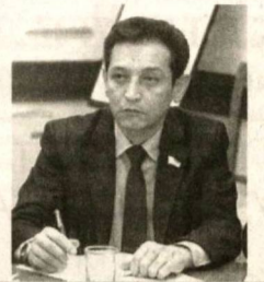
Акmalжон УМАРАЛИЕВ, депутат Законодательной палаты Олий Мажлиса, член фракции НДП Узбекистана, член Комитета по вопросам промышленности, строительства и торговли

фактор улучшения жизненного уровня населения