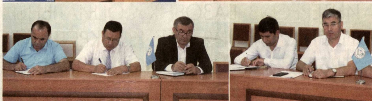
ОБСУЖДАЕМ ПРОЕКТ ПРЕДВЫБОРНОЙ ПРОГРАММЫ ПАРТИИ