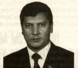
Саттор РАХМАТОВ, депутат Законодательной палаты Олий Мажлиса, член фракции НДП Узбекистана.

Отсутствие в Узбекистане конкретных критериев и принципов в данном вопросе, а точнее то, что они все еще не разработаны, не позволяет выявлять семьи, которые действительно нуждаются в социальных пособиях, выплачиваемых органами самоуправления граждан (в махаллах по месту жительства). В ходе встреч на местах население часто обращается к депутатам Законодательной палаты с жалобами на то, что в махаллах нарушаются принципы социальной справедливости в процессе распределения социальных пособий, высказывают свое резкое недовольство по этому поводу.