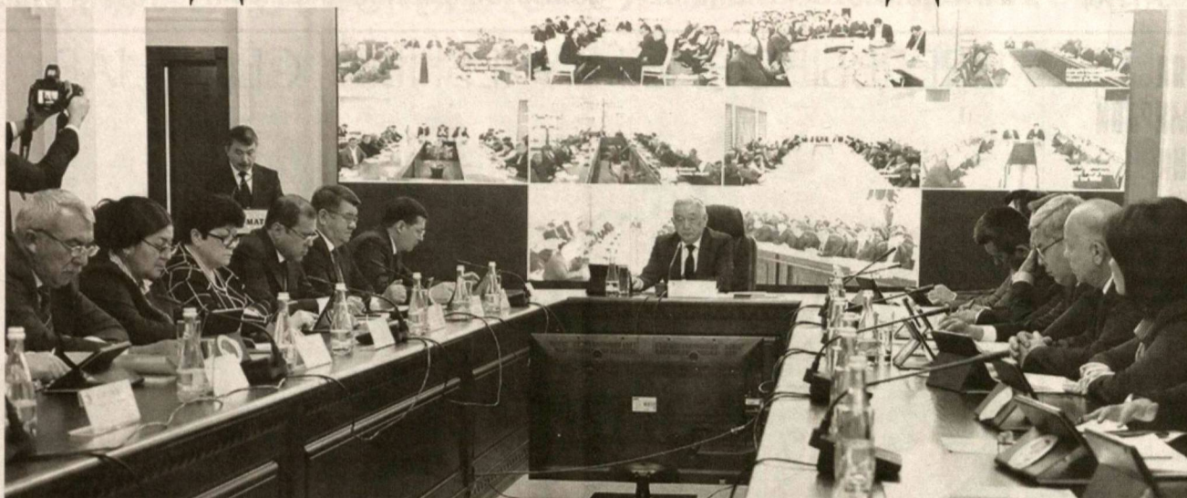
В столице состоялось очередное заседание Центральной избирательной комиссии Республики Узбекистан, в котором приняли участие члены Центризбиркома, представители политических партий, СМИ.

В повестку дня вошли такие вопросы, как информация хокима города Ташкента и председателя Ташкентской городской избирательной комиссии о проделанной работе в плане подготовки к выборам, вопросы оснащения избирательных участков средствами связи, а также информация Министерства по развитию информационных технологий и коммуникаций по формированию ЕЭСИ.