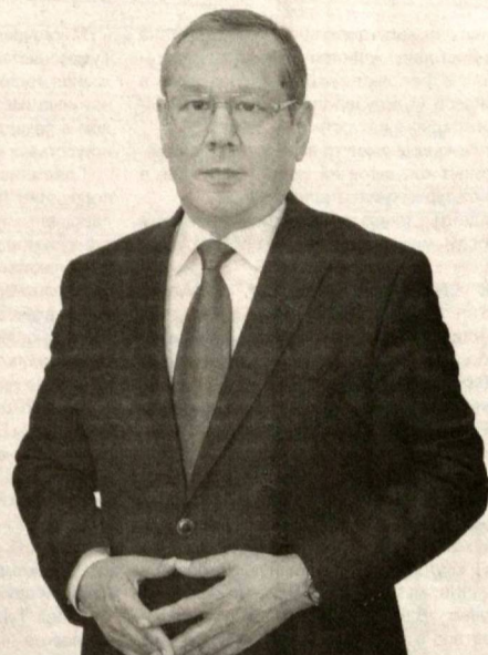
Улугбек ИНОЯТОВ, председатель Центрального Совета Народно-демократической партии Узбекистана

Итак, что же такое прожиточный минимум и потребительская корзина и зачем это нам нужно?