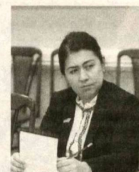
Феруза ЭШМАТОВА, депутат Законодательной палаты Олий Мажлиса, член фракции НДП Узбекистана.