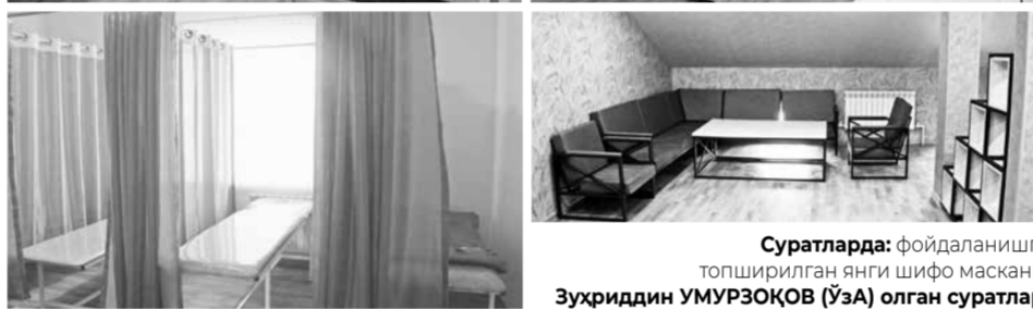
Суратларда: фойдаланишга топширилган янги шифо маскани.