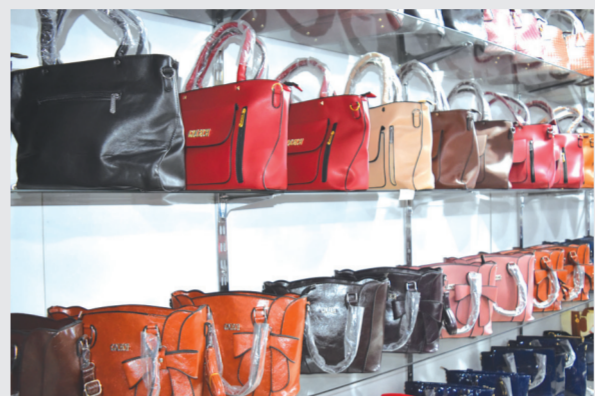
Матн ва суратлар муаллифи Ш. ҚОРАБОЕВ.

Иш бошлаганимизга 3 йил бўлди, — дейди жамият бошқаруви раиси Дониёр Сайдалиев. — Дастлаб 25-30 турдаги сумкалар тикилган бўлса, айна вақтда уларнинг тури 250 хилдан ортди. Бичув, тўқув, қадоқлаш цехларида 30 нафар ишчи меҳнат қилади. Ҳар ой 220-250 миллион сўмлик маҳсулот тайёрланмоқда. Қишлоқ маркази ва Кўкун шаҳридаги жамият савдо дўконлари доимо гавжум. Улғурчи харидорлар орасида қирғизистонлик ва тоjikистонлик мижозлар ҳам бор.