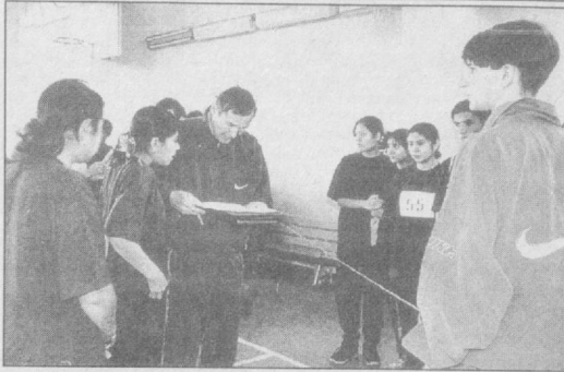
СУРАТЛАРДА: Алпомиш ва Барчиной тест синовлари мусобақаларидан лавҳалар.

спорт турлари ва халқ ўйинларини ривожлантириш миллий спорт маркази, Тошкент шаҳар жисмоний тарбия ва спорт қўмитаси томонидан таъсис этилган кўрак нишонлари, гувоҳномалар, фахрий ёрликлар ва қимматбаҳо совгалар топширилди. Шунини таъкидлаб ўтиш жоизки, пойтахт ўрта махсус касб-хунар тизимида жами 121 та ўқув муассасалари мавжуд бўлиб, эндиликда лицейлар, акаде-