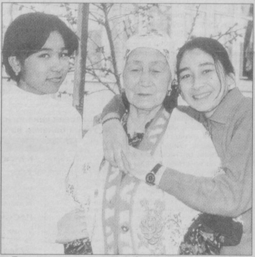
Бағрингиз мунча иссик, бувижон!