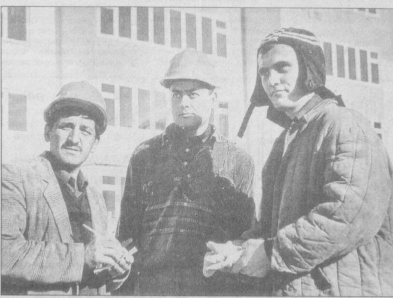
Қишнинг совуғи, ёзнинг саратонини ҳам писанд қилмай меҳнат қилаётган қурувчиларимиз ғайрати эвазига юзлаб оиналар янги уйлارга қўчиб ўтишмоқда.