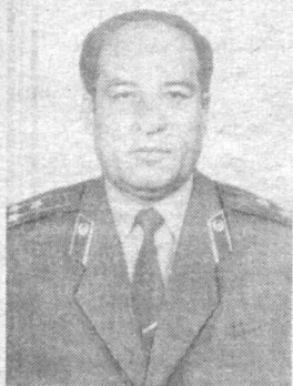
С уважением руководство, личный состав ГУИН МВД Республики Узбекистан.

Руководство, личный состав УВД Ташкентской области.