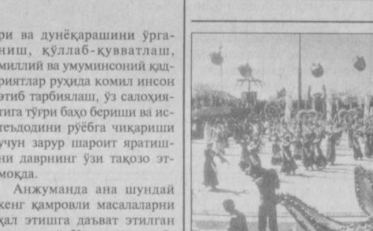
ТОШКЕНТ ШАҲАР ҲОКИМЛИГИДА

Ўзбекистон Миллий матбуот марказида «Камолот» ёшлар ижтимоий ҳаракати ташаббус гуруҳининг йиғилиши бўлиб ўтди. Унда мамлакатимиз Президент Ислам Каримовнинг мазкур гуруҳ аъзолари билан учрашувда сўзлаган нутқидан кейин чиқадиган вазидалар муҳокама этилди. Сўзга чиққанлар Юртбошимизнинг нутқи жойларда кунт билан ўрғинаётгани, қизгин баҳс ва мунозаралар уйғотаётганини таъкидладилар. Мамлакатимизда ёшлар ҳаёти ва ижтимоий фаолияти билан боғлиқ бир қатор муаммолар ўз ечимини кутмоқда. Мустақил ҳаёт останада турган ёшларнинг бошини қўвуштириш, эзгу мақсадлар йўлида бирлаштириш, уларнинг орзу-умидлар