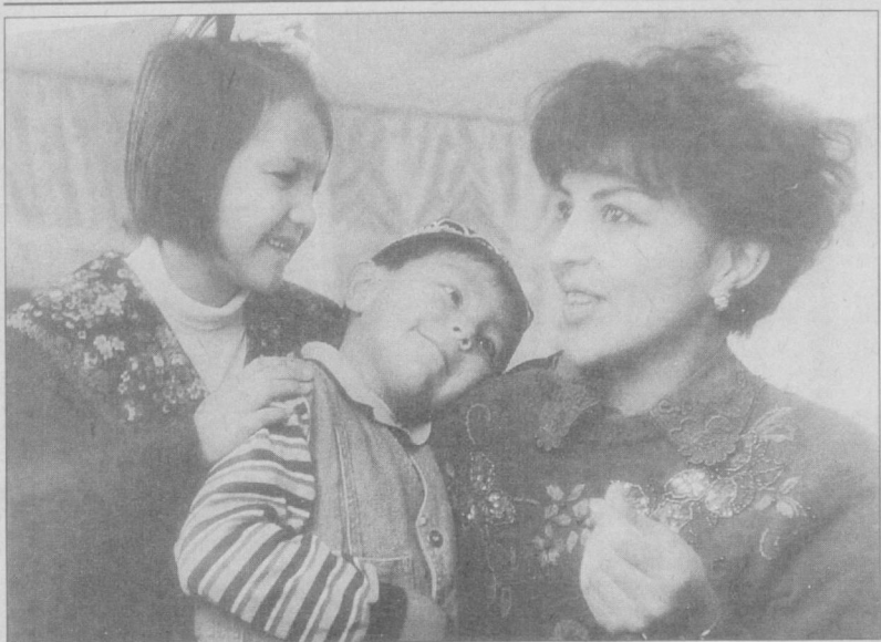
Онажоним – меҳрибоним.