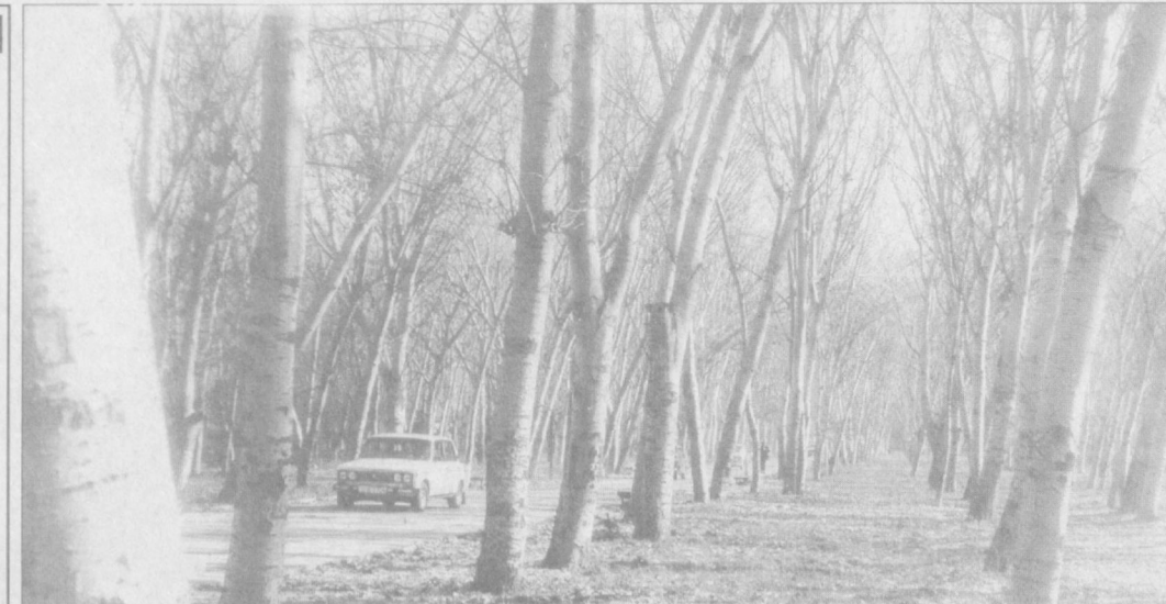
Киш оғушидан уйғонаётган табиат.