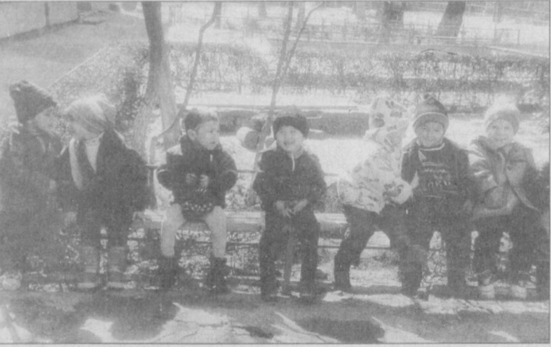
Бола билан нурафшон олам.