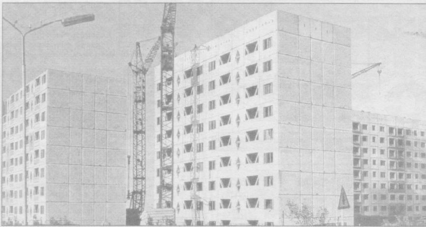
Юнусобод туманининг Шахристон бекатида қад кўтарган янги бинолар.