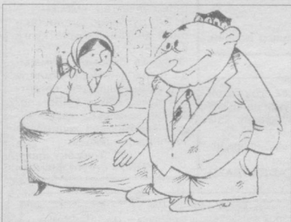
— Бугун яна шўрва ичамизми, хотин. — Сизга фойдали, бироз озасиз.