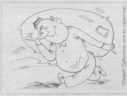
Чайковчи: — Менинг ишим — бир бозордан олиб ик-кинчи бозорда сотиш.