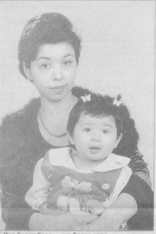
Она билан бола — гул билан лола.