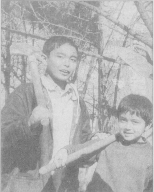
Кучат экиб, боғ яратамиз.

Бехудий Истиқлол курашчиси дедик. Эътибор қилайлик: у ҳурматли зот тарихимиз майдонига чикиб онгли ҳаёт кечира бошлаган давр — XX асрнинг 10-йиллари — қандай давр эди. Чор мустақиллигининг босқинчилик сийсати Туркистонда гўзал бир ўлкада росман авжга чиққан, миллий маънавиятимиз, маданиятимиз, гуруримиз, айтиш мумкинки, бутун ўзлимизни поймол қилганган, миллий озодлик курашчилари бошларига балолар ёғдирилаётган бир фожияли йиллар эди. Бехудий за-