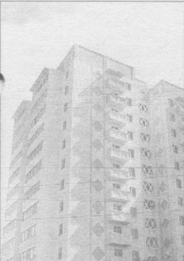
Пойтахтимизнинг Юнусобод даҳасида бунёд этилаётган уй-жойларда 3-контанейрли курилиш бошқармаси курувчилари йайрат кўрсатишмоқда.