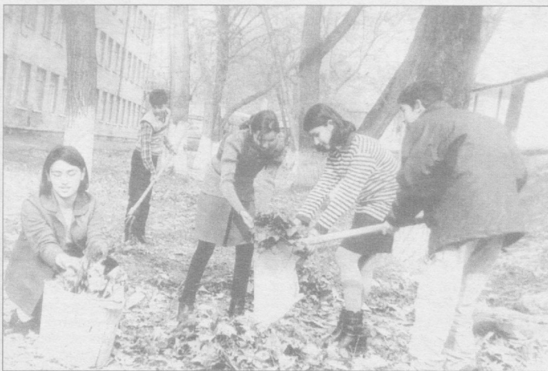
Баҳор келди, пешвоз чиқайлик.