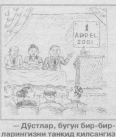
— Дўстлар, бугун бир-бирларингизни танқид қилсангиз бўлади.