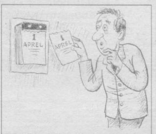
Изоҳнинг ҳождати йўқ.