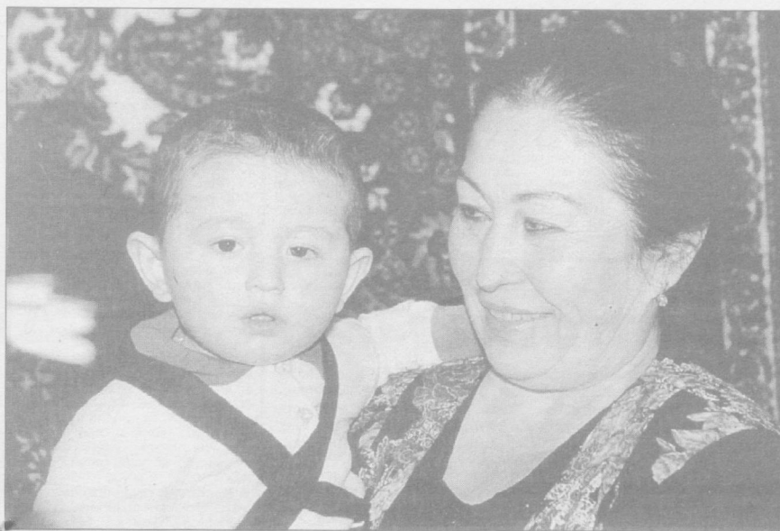
Болагинамнинг боласи — қантак ўрикнинг донаси...