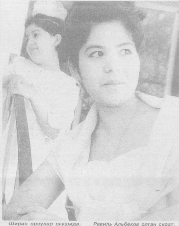
Ширин орзулар оғушида.