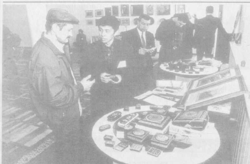
Шаҳримизда ўтказилган «Ташаббус-2001» кўрик-танловда туманларнинг энг яхши тадбиркор ва моҳир хўнарамдлари ўзлари тайёрлаган маҳсулотларни намойиш этишди. Бу маҳсулотлар кўпчилигининг эътиборини қозонди. СУРАТДА: танловга қўйилган хўнарамдчилик маҳсулотлари.