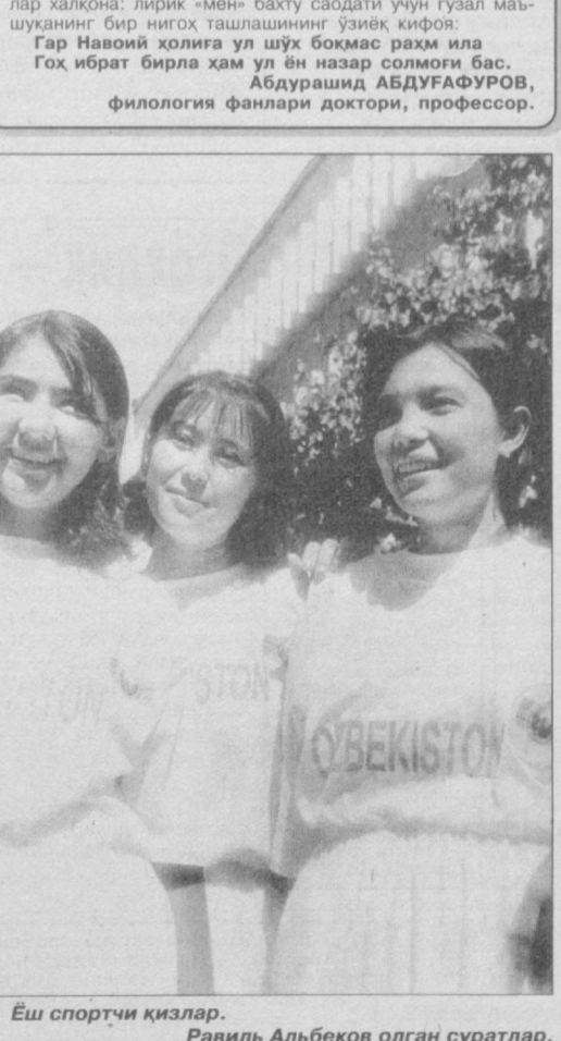
Ёш спортчи қизлар.