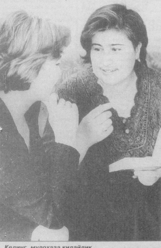
Келинг, мулоҳаза қилайлик.

Гар Навоий холига ул шўх боқмас раҳм ила, Гоҳ ибрат бирла ҳам ул ён назар солмоғи бас.