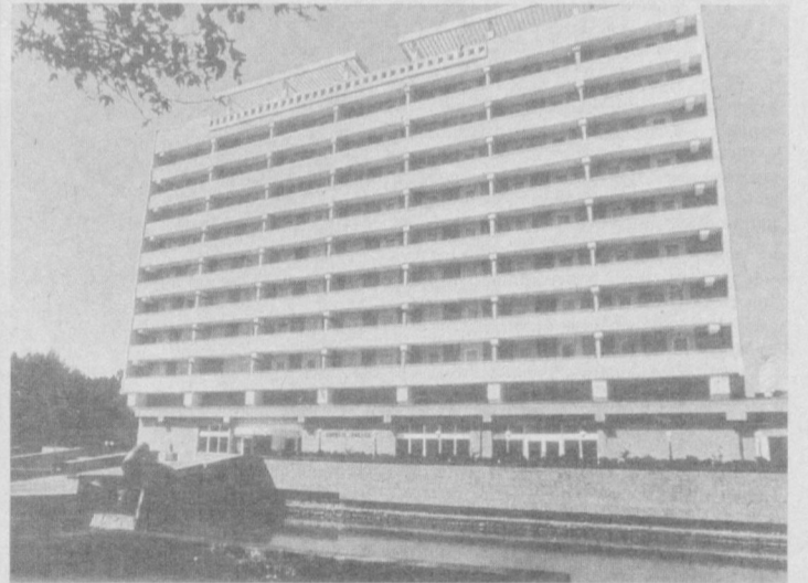
Шаҳримизга гўзал биналар ярашади.