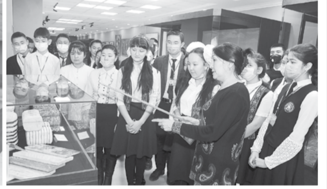
Суратларда: Нукус шаҳридаги Қорақалпоғистон Республикаси тарихи ва маданияти давлат музейи.