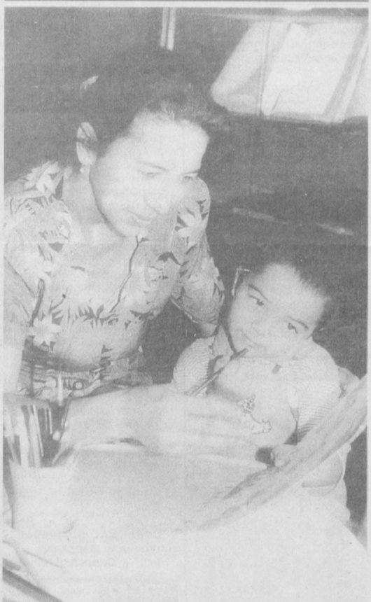
Санъатнинг соҳрили оламга сабаҳат.