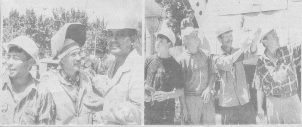
СОҒЛОМ АВЛОД УЧУН