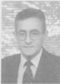
Мамдух ШАВКИЙ, Миср Араб Республикасининг Фавқуллода ва Мухтор элчиси.