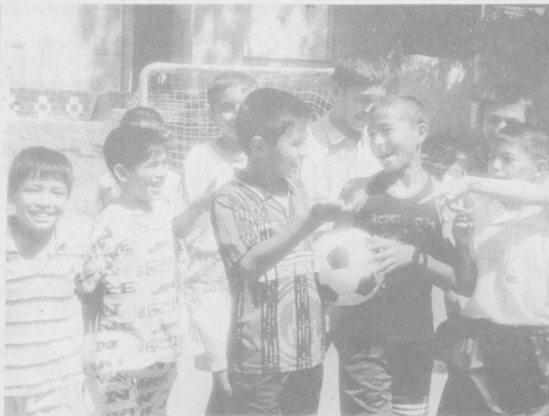
Бугун албатта галаба қозонамиз.

• Мурод, мақсад ҳазиналари меҳнат кўприги устидадир. • Ақл ва фаросат қўёшга ўхшайди, бепарволик туфайли тушиши мумкин бўлган доғларга ўрин қолдирмайди. • Ортиқча саодатга интилиш саодатни қўлга киритишга тўқсинлик қилади.