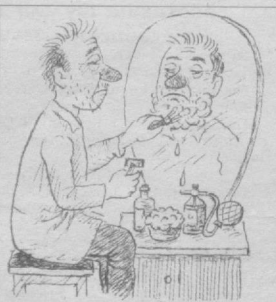
Изоҳнинг ҳождати йўқ.