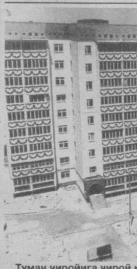
Туман чиройига чирой қўшаётган замонавий турар жой бинолари.

Юнусоҳжи вафотидан сўнг ерли аҳоли оқсоқолларининг маслаҳатида биноан бу боғ-роғли маскан 1897-1900 йиллари