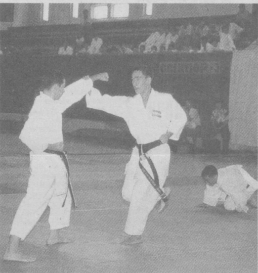
СУРАТДА: мусобақа пайти.