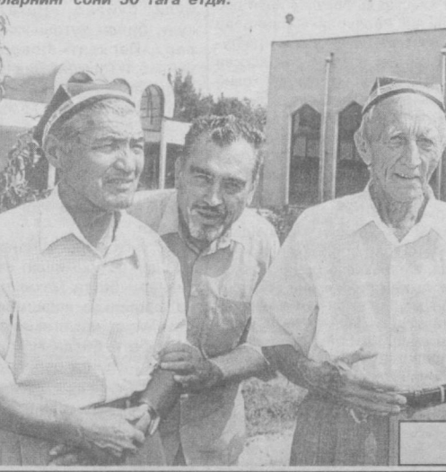
Хамза тумани ҳақидаги мақолалар билан газетанинг 2-бетдаги махсус саҳифада танишасиз.

Хамза туманининг умумий майдони 3 минг гектардан ортиқ бўлиб, бу ерда 213,165 аҳоли ҳайшайди. Жорий йилнинг ўтган орти ойда тумандаги мавжуд саноат корхоналарида 34,3 миллиард сўмлик, яъни ўтган йилнинг шу даврига нисбатан 1162 миллион сўмликдан ортиқ маҳсулот ишлаб чиқарилиди.