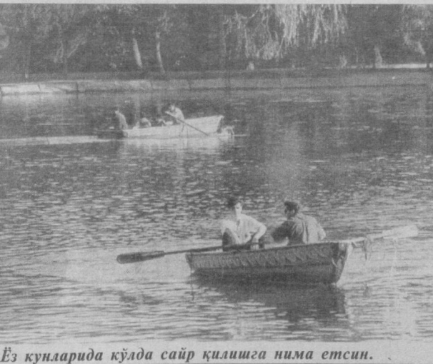
Ўз кунларида қўлда сайр қилишга нима етсин.