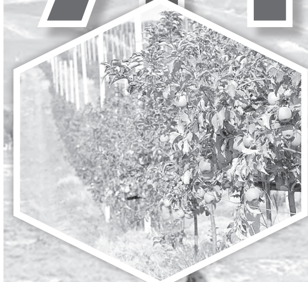
(Давоми. Бошланиши 1-саҳифада).

Самарқанднинг кунчиқар бетини яримта ой сингари ўраб турган Зарафшон тоғ тизмалари этакларида товланиб ётган бу манзилда эрамиздан аввалги юз минг йилликларда ҳам аждодларимиз умргузаронлик қилганлар. Бу тупроқда тош ва бронза даврларига оид бебаҳо тарихий ёдгорликлар мавжудлиги, Ҳазрат Фавсул Аъзам, Хўжа Закарий авлиёи Варрак, Хўжа Омон, Хўжа Тилиби Сармаст, Хўжа Абдол, Ширвоқ ота, Хўжа Иброҳим Кадут каби улўғ сиймоларнинг макбара-ю қабрлари борлиги, Хўжа Аҳрори Валий ҳазратлари ҳам бир қанча муддат Камангарон қишлоғида яшаганлари юртошларнинг қатори менинг кўксимни ҳам фахру ифтихорга тўлдиради. Мирзо Бобур ҳазратларининг Ургут — жаҳонда камдан-кам учрайдиган гўзал маскан экани ҳақида тўлқинланиб ёзганларини; XV асрда юртимизда бўлган араб сайёҳи Ибн Ҳовқалнинг: «Самарқанднинг жанубида Шовдор тоғлари жойлашган. Атрофда бу вилоятчилик киши саломатлиги учун тоза ҳаволи маскан, серҳосил экинзор, энг яхши мевазор боғлар йўқ. Кишиларнинг қадди келишган, юзлари ёруғ...» деганларини ўқиганда эса ғурурдан қўш бўлиб учгиларим келиб кетади.