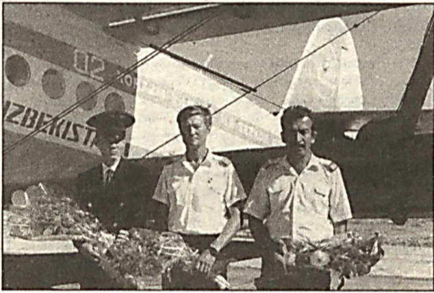
Моменты мероприятия по торжественному вводу взлетной полосы в УВД Хорезмской области.