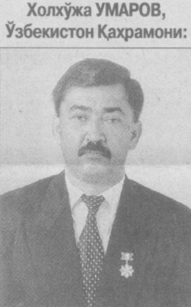
Холжўжа УМАРОВ, Ўзбекистон Қаҳрамони:

— Истиқлолимизнинг муборак 10 йиллиги тобора яқинлашмоқда. Ушбу шодана кунда албатта ҳар биримиз босиб ўтилган йўлга назар ташлаймиз. Мен қурувчи бўлганлигим сабабли кўпроқ янги қуриланган йўллар, бинолар, боғларни кўриб қувонаман. Атрофга бир ҳолисона назар ташланг. Пойтахтимиз Тошкентнинг кўринишини кўриб қўзингиз қувнайди. Янги барпо этилган меҳмонхоналар, банклар, бориники, аҳолининг уйларини кўриб 10 йил давомида рўй берган ўзгаришлар нақадар улғувор эканлигига амин бўламиз. Ўзгаришлар нафақат иқтисодиётда, қурилишда, ҳатто онгимизда юз берганлиги ҳаммамизга аён. 10-15 йил аввал чоп этилган китобларни олиб бир варақлаб кўрсангиз ҳозирги вақтда тилимизга, тарихимизга эътибор қанчалик кучли эканлигини ҳис қиласиз. Ўзим мисолимда айтсам эл қатори қурилишда ишлаб юрган оддий ўзбек йигитиман. Халқлар дўстлиги саройидан бошлаб ҳозирги қурилаган консерватория ва урология маркази биноларигача бўлган қурилишларда иштирок этиб келдим. 1997 йилда камтарона меҳнатларимни инобатга олиб Ўзбекистон Қаҳрамони юқаск унвони берилганини эшитганимда кўзимга қувонч ва гурур ёшлари келганини эслайман. Ҳар биримизнинг меҳнатимиз — ўзимизнинг фаровонлигимиз, келажак авлоднинг тинч-тотув яшаши гаровидир. Имкониятдан фойдаланиб ҳамшаҳарларимизни шодана кун, халқимизнинг буюк — байрами Мустақиллик кунининг 10 йиллиги муносабати билан муборакбод этаман.