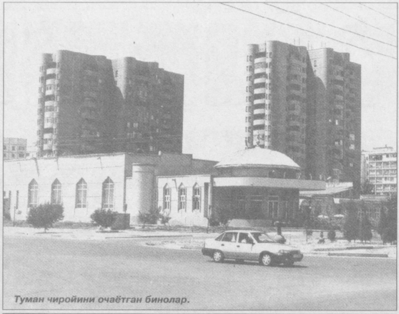
Туман чиройини очётган бинолар.

ТАРИХ СОЛНОМАСИДАН Замонавий Тошкент шаҳри доирасида (яъни 280 квадрат километрдан ошқ майдонда) ҳозирги кунда 20 га яқин археология ёдгорликлари — кўҳна шаҳарлар қолдиқлари мавжуд бўлиб, уларда Ўзбекистон пойтахтининг бутун қадимий тарихи мужассамлашган. Улар орасида Сергели тумани ҳудудида жойлашган Шоштепа кўҳна шаҳарчаси ҳам мавжуд бўлиб, у тарихий аҳамияти бўйича аҳолида ўрин тутайди. Қадимда Шоштепа 20 гектардан ошқ майдонни эгаллайди, бироқ ҳозирда унинг факат Чоштепа кўчаси бўйича Жун каналнинг чап қирғоғига жойлашган 30 метр балангликдаги қўғонни маркази сақланган қолдиқ, холос.