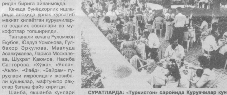
СУРАТЛАРДА: «Туркистон» саройида Қурувчилар кунига бағишланган тантанали кечадан ва истироҳат боғларидаги сайиллардан лавҳалар.

лари, ҳайвонот боғида Қурувчилар кунига бағишланган байрам тадбирлари, оммавий сайиллар ўтказилди. Барча уйин аттракционлари қурувчиларнинг фарзандлари учун бепул хизмат кўрсатди. Ўз муҳбиримиз.